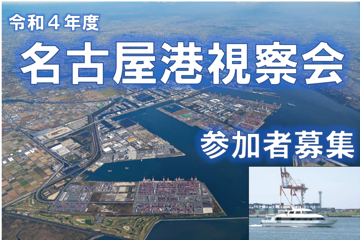
港務艇「ぼーとおぶなごや2」で 船上から名古屋港視察